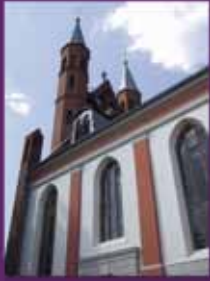
St. Marienkirche Kyritz

In diesem Jahr sind trotz der noch immer aktuellen Pandemie interessante Konzerte und Veranstaltungen in der St. Marienkirche geplant und ich hoffe sehr, dass alles wie vorgesehen stattfinden kann.